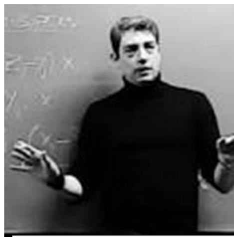
WILHELM CONRAD RONGER