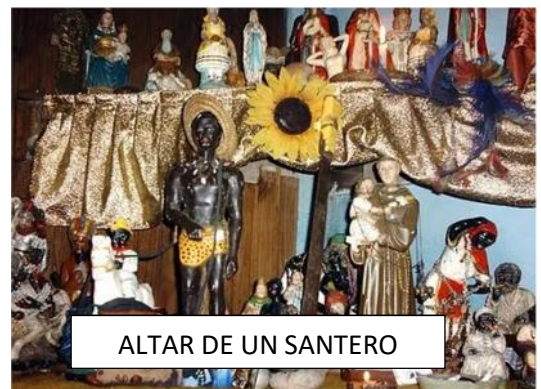
ALTAR DE UN SANTERO

La SANTERIA es la combinación de elementos animistas y fetichistas traídos por los esclavos del África con las enseñanzas cristianas de los conquistadores y sacerdotes europeos. Literalmente significa "culto de los santos" y se practica en varios países empezando por Cuba. En Haití toma el nombre de vudú o kimbanda en Brasil y CHAN GO en Trinidad. En este sincretismo religioso también aparecen elementos propios de la brujería, paganismo y supersticiones europeas que ya coexistían entre los españoles y portugueses antes del descubrimiento de